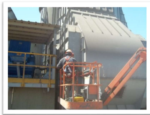
Montaje del motor