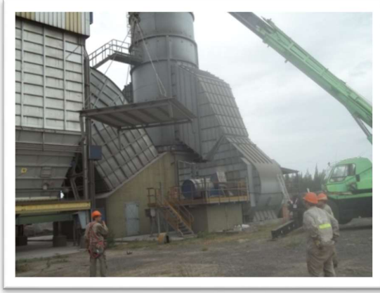
Desmontaje techo del motor

Trabajo realizado: Cambio de motor y rotor de ventilador