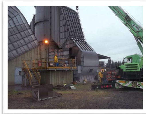
Montaje de ventilador